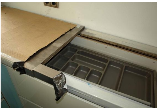
Junta por soldar de las dos encimeras