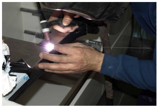
Comienzo de la soldadura